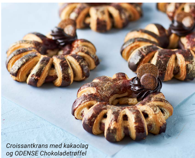
Croissantkrans med kakaolag og ODNSE Chokoladetrøffel

Med dit valg af pynt og fyld kan du løfte croissanter et niveau op i pris – og hæve fristelses-niveauet i disken til "uimodståeligt"! Samtidig kan croissanter gøre dit bageri relevant dagen igennem - som den lille on the go-snack, mødeforplejning til de lokale virksomheder, mini-croissanter til receptionen og meget mere.