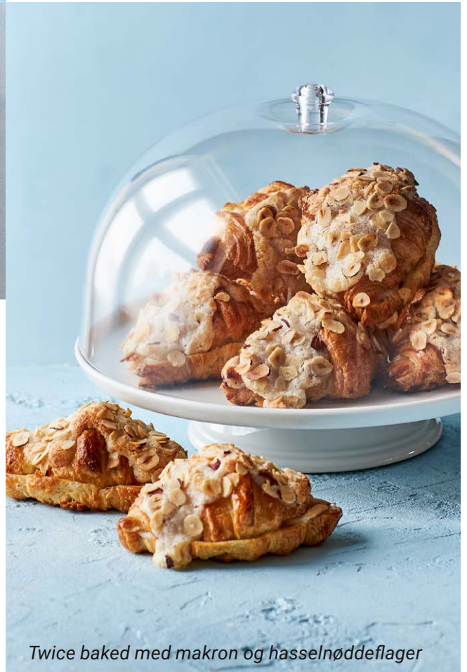
Twice baked med makron og hasselnøddeflager

Croissanten har eksisteret i flere hundrede år, lige siden en østrigsk bager i Paris lavede den klassiske gærdejs giffel om og bagte den i butterdej. Voila! som franskmændene siger, så havde han skabt croissanten.