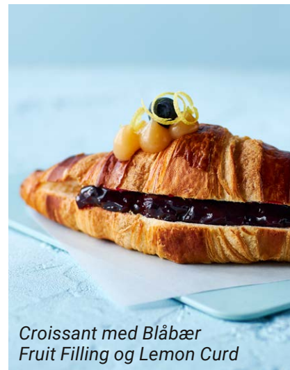
Croissant med Blåbær Fruit Filling og Lemon Curd