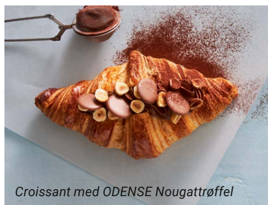
Croissant med ODNSE Nougattrøffel