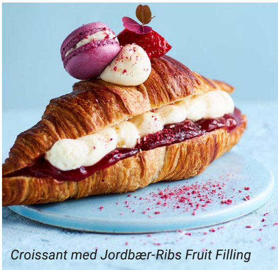
Croissant med Jordbær-Ribs Fruit Filling