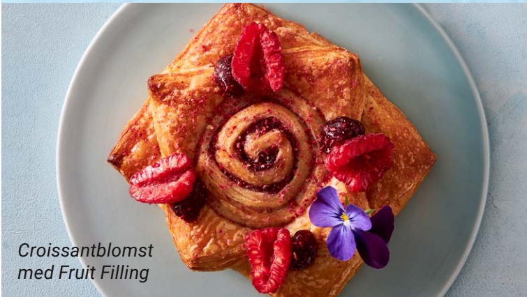
Croissantblomst med Fruit Filling