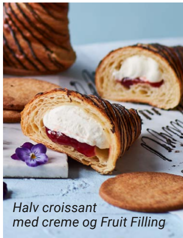
Halv croissant med creme og Fruit Filling