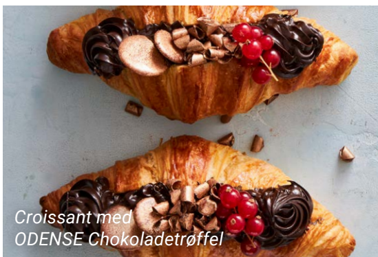
Croissant med ODENSE Chokoladetrøffel

Der kan pyntes med ALT fra spiselige blomster, chokoladeoblater, macarons, frysetørret drys, støv m.v. Eksperimentér gerne med forskellige udtryk. Kunderne vil elske at komme igen og se hvad I nu har fundet på. Find mere inspiration på www.odense-konditoriet.dk/crazy-croissant