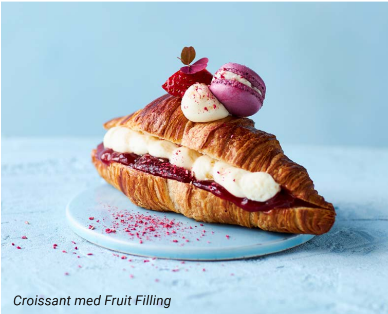
Croissant med Fruit Filling