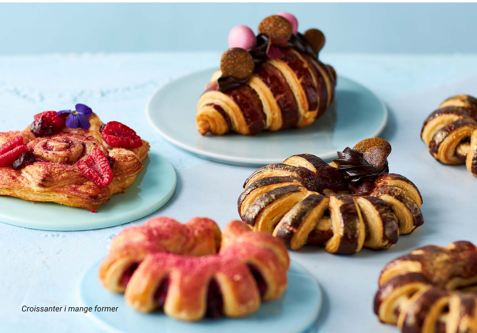
Croissanter i mange former