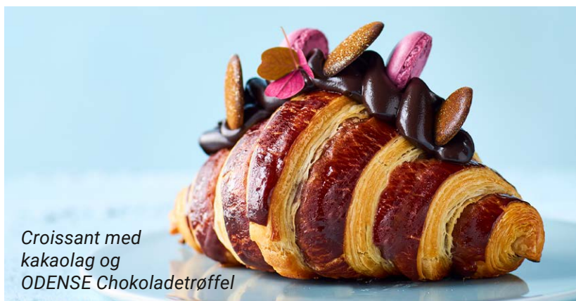
Croissant med kakaolag og ODENSE Chokoladetrøffel

Giv dine croissanter spændende/anderledes navne som Twice baked, Croissant square, Croissant rolls eller Croissant spiral.