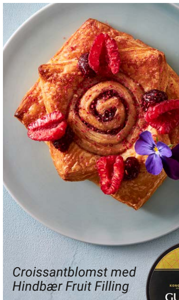
Croissantblomst med Hindbær Fruit Filling