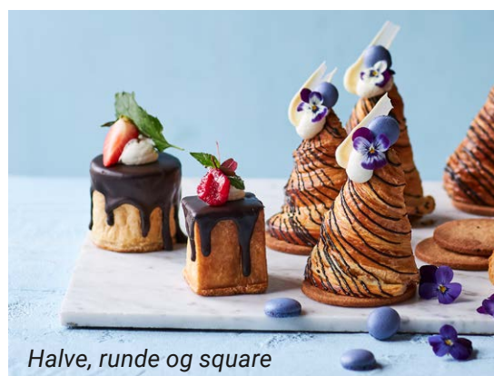
Halve, runde og square