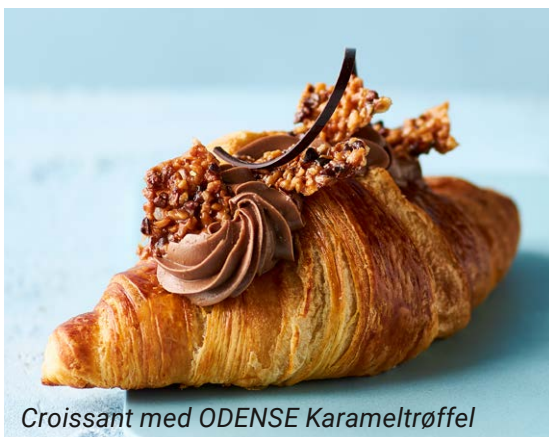
Croissant med ODENSE Karameltrøffel

Dekorér dine croissanter med chokoladepynt og ODENSE Guld Støv for en flot skinnende effekt.